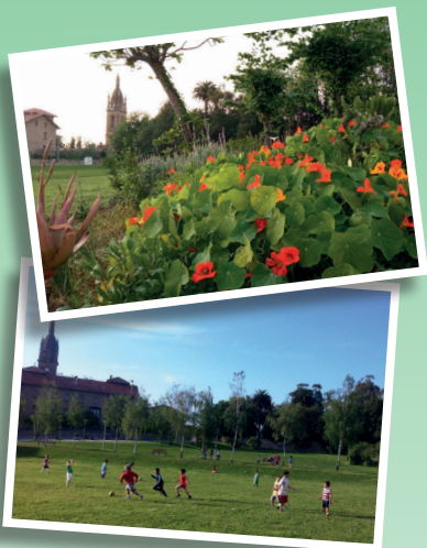
Lantzarte Bizirik Auzo Elkartea, auzokideon elkarbizitza eta partaidetza soziala indartzeko sortu da.

La idea de crear la Asociación nació durante la pandemia con el objetivo de articular una serie de iniciativas para cuidar y mejorar el entorno natural de nuestro barrio y, a la vez, impulsar actividades socioculturales que ayudarán a estrechar las relaciones vecinales intergeneracionales para una comunidad más cohesionada y humana .