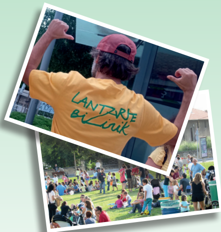
Lantzarte Bizirik, gure auzoari buruzko kezak partekatze gunea da eta proposamen berriak eztabaidatzeko eta lantzeko leku aproposa.