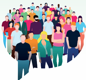
Ikuspegi eraikitzailetik ekintza kolektiboarekiko konpromiso pertsonala eta borondatezkoa da.

Porque no existe una Asociación ciudadana que se preocupe por dinamizar y fortalecer la participación, la convivencia y la integración vecinal desde una perspectiva constructiva e intergeneracional . Se trata de un compromiso personal y voluntario con la acción colectiva.